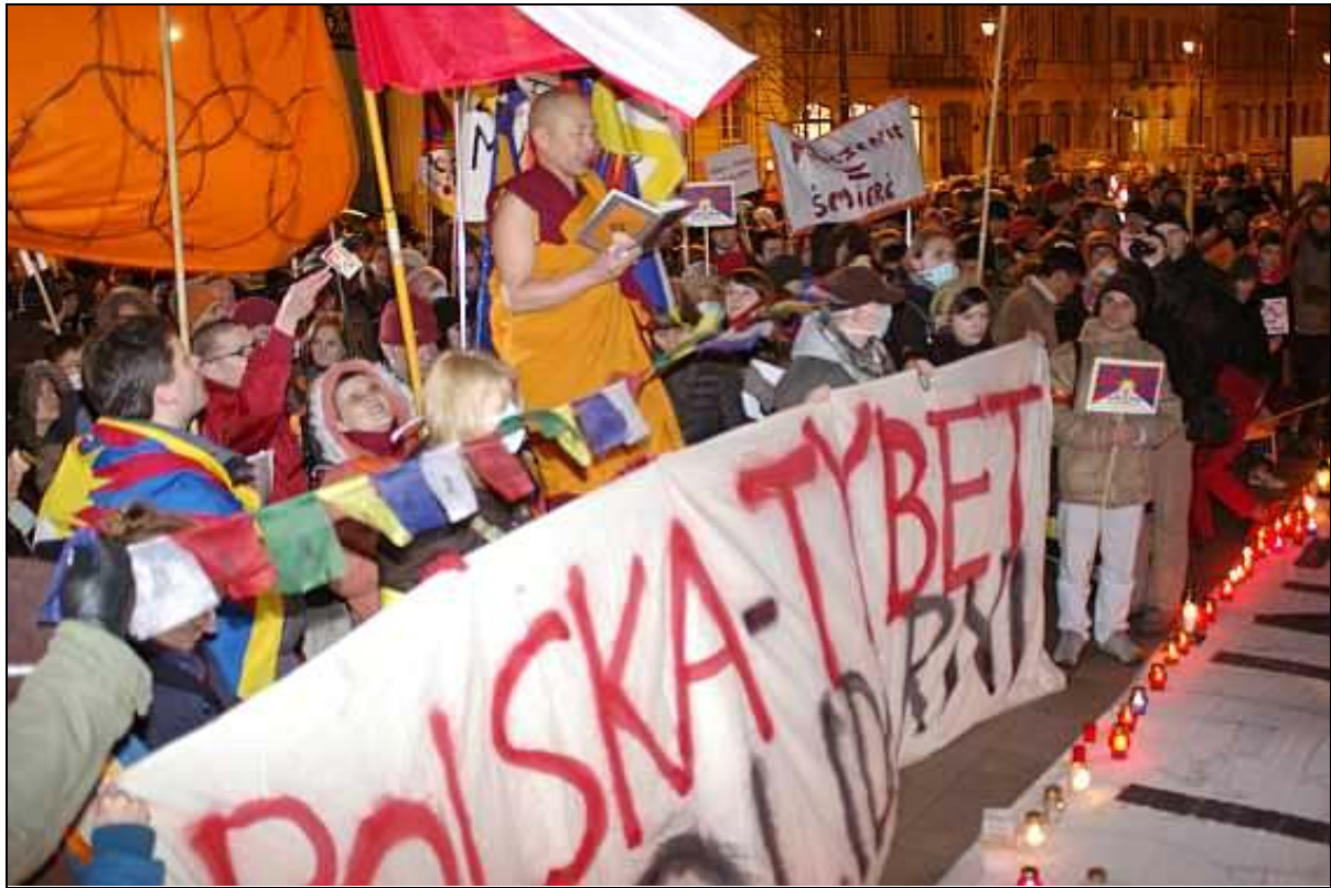
Demonstracja przed Pałacem Prezydenckim w Warszawie.