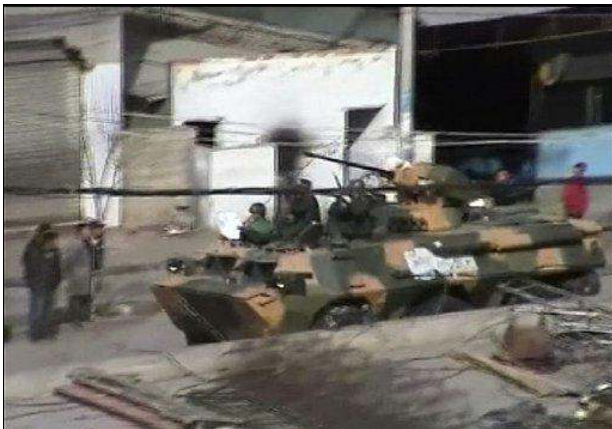
Chińskie wojsko na ulicach tybetańskiej stolicy, Lhasy, po krwawym stłumieniu protestów 14 marca 2008 r.

W 2008 roku braliśmy udział w wielu międzynarodowych akcjach na rzecz Tybetu. Większość z nich odbywała się w ramach dwóch kampanii: reakcji na historyczne protesty w Tybecie oraz kampanii olimpijskiej koordynowanej przez ITSN, której główne działania zostały opisane w następnym rozdziale.