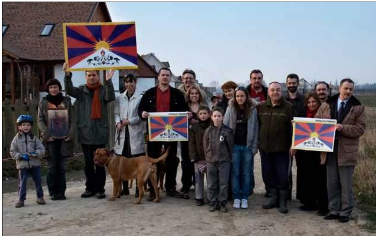
Akcja Solidarni z Tybetem, Osada Łoziska, 31 marca 2008

W związku z trwającymi w Tybecie i na całym świecie protestami oraz trasą znicza olimpijskiego, przebiegającą według planów przez Tybet, ITSN ogłosił 31 marca Dniem Solidarności z Tybetem. Tego dnia Fundacja Inna Przestrzeń i Gazeta Wyborcza zorganizowały akcję Solidarni z Tybetem: flaga Tybetu została dołączona jako okładka do „Dużego Formatu” – cotygodniowego dodatku do Gazety Wyborczej. W sumie wydrukowano ponad pół miliona tybetańskich flag