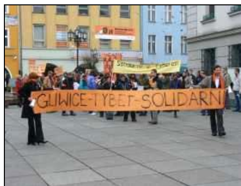
Akcie solidarności z Tybetem w Krakowie i Gliwicach.

„Wolny Tybet! – niosło się wczoraj wieczorem po poznańskim Starym Rynku z blisko 300 gardeł zaniepokojonych łamaniem podstawowych praw człowieka w Tybecie. Politycy namawiają swoich kolegów do bojkotu ceremonii otwarcia igrzysk olimpijskich w Pekinie”.