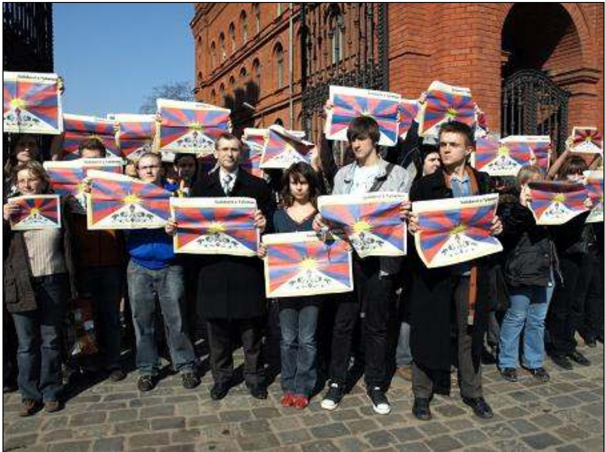
Flashmob w Łodzi z wykorzystaniem flag wydrukowanych przez Gazetę Wyborczą w ramach kampanii Solidarni z Tybetem, w akcji udział wzięł m.in. łódzki senator Krzysztof Kwiatkowski.