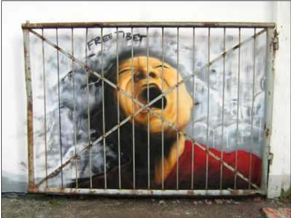
Graffiti wykonane przez członków grupy 3 fala w Dreźnie w trakcie międzynarodowego projektu „Du Dialogue Social”.

na rzecz Tybetu oraz billboard zapraszający na Alternatywne Otwarcie Olimpiady w Warszawie. Poza Graffiti powstawały także bannery i wlepki – więcej o Graffiti dla Tybetu można znaleźć na stronie www.3fala.art.pl