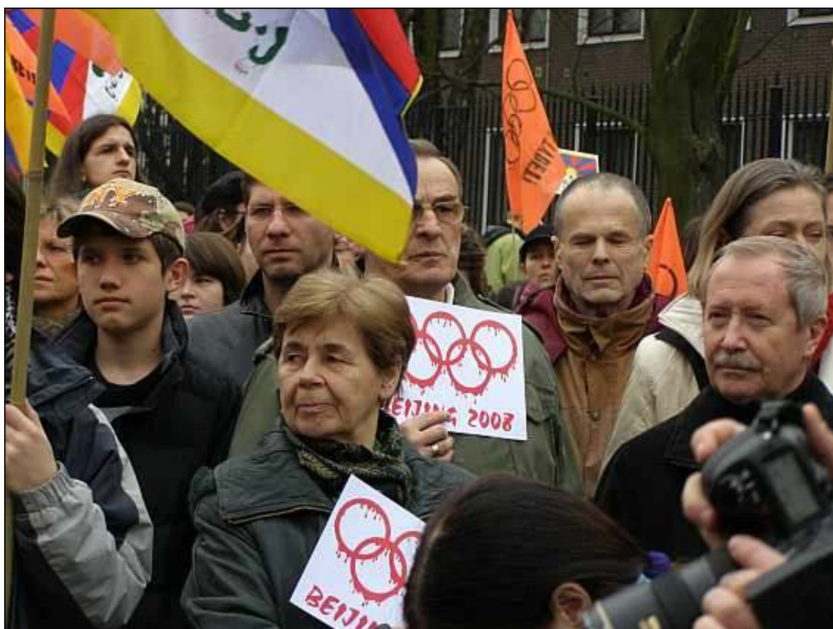
Demonstracja przed Ambasadą Chińskiej Republiki Ludowej, na zdjęciu senator Zbigniew Romaszewski oraz Wiceprzewodniczący Parlamentu Europejskiego Janusz Onyszkiewicz.

Demonstracja w odpowiedzi na wydarzenia w Tybecie, 16 marca