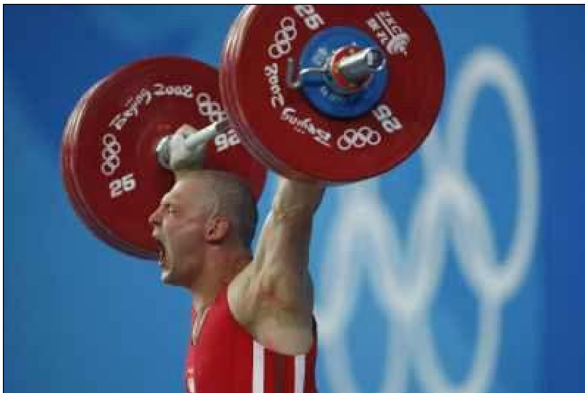
Szymon Kołecki, polski sztangista, który jako jedyny wyraził solidarność z Tybetańczykami podczas Igrzysk w Pekinie – przed startem zgodnie z zapowiedzią zgolił głowę.

W ramach międzynarodowej kampanii „Sportowiec Poszukiwany” (Athlete Wanted), której strona internetowa została przetłumaczona na j. polski, wolontariusze Programu Tybetańskiego Fundacji Inna Przestrzeń docierali do sportowców z informacjami dotyczącymi tego, w jaki sposób Olimpijczycy mogą pokazać solidarność z uciskanymi Tybetańczykami. Dotarliśmy do 152 sportowców reprezentujących Polskę na Igrzyskach Olimpijskich w Pekinie, wysyłając im wiadomość przez portal nasza-klasa.pl i proponując różne możliwości działań, m.in. ogolenie głowy. Oficjalnie wszelkie symbole czy deklaracje o charakterze politycznym są zakazane w czasie Igrzysk, jednak sportowcy mogą swobodnie wypowiadać się poza obiektami olimpijskimi. Ponadto Prezes PKOl-u publicznie zadeklarował, że nie będzie wyciągał konsekwencji wobec polskich sportowców, jednak ostrzegł przed konsekwencjami ze strony struktur międzynarodowych.